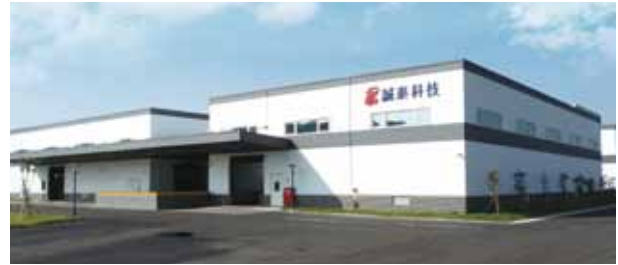
誠泰工業科技股份有限公司—高雄科學園區 邊牆使用 燁輝輝彩消光礦纖烤漆鋼捲